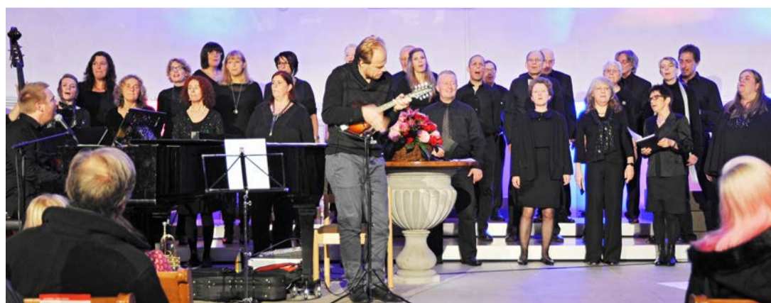
Gospel Singers in der Alten Kirche Wollishofen