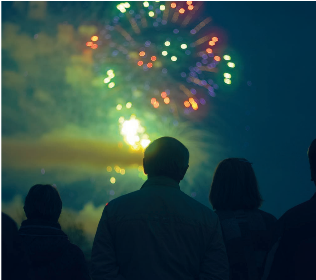
Staunen, geniessen und abschalten, bevor der Alltag wieder beginnt.

Leimbach. Sie sind herzlich willkommen zum Start des Wähentags, einmal im Monat. Familien, Alleinstehende, Jugendliche, alle sind herzlich willkommen (kein Kinderhütendienst!). Freitag, den 29. Januar 2016 ab 12.00 Uhr im Saal des reformierten Zentrums; bitte mit Anmeldung! (Sekretariat: 044 482 64 13) Zum Start dieses neuen Angebots sind Sie herzlich eingeladen; ab Februar wird ein Unkostenbeitrag erhoben.