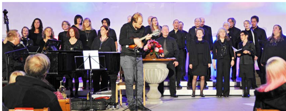
Gospel Singers in der Alten Kirche Wollishofen

WOLLISHOFEN/ Gospel Singers Wollishofen zu Besuch in den Gottesdiensten im Januar